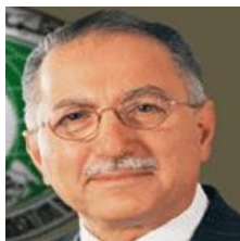
Professor Ekmeleddin Ihsanoglu Secretary General of the Organization of the Islamic Conference